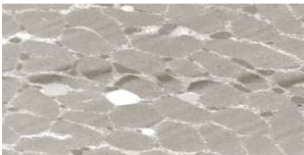
Figuur.2. Normale spier bij een gezonde en sportieve 34 jarige man – X90/6851 Narula, Declerck, Kakulas – Neuropathologie, Perth, West-Australië

Een strakke buik is hét kenmerk bij uitstek van een gezond en fit lichaam. Uw buikspieren worden de gehele dag door aangesproken of u nu zit, staat of gaat. Buikspieren zijn eveneens zeer belangrijk bij de uitoefening van alle dagelijkse inspanningen. Wanneer dan de toevoer aan calorieën (suikers, vetten en eiwitten) vanuit de voeding hoger ligt dan de behoeften eraan, zal dit uiteindelijk leiden tot vetopstapeling in deze spieren. Omdat overgewicht gepaard gaat met een onevenwichtige verhouding tussen spiermassa en vetmassa, stelt men vast dat er zich in deze situatie ook meer vet opstapelt in de buikspieren net zoals dit het geval is bij een tekort aan lichaamsbeweging en sport (Fig.2, 3, 4). Omdat buikspieren een zeer belangrijke rol spelen in het basaal metabolisme (zie hoger), zal de productie aan energie (ATP) minder uitgesproken zijn naarmate er zich dan ook meer vet opstapelt in de spieren.