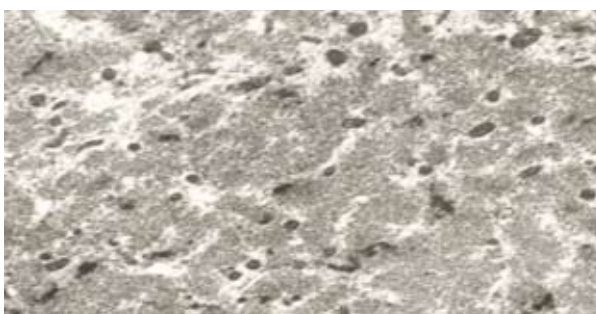
Figuur.4. Volledige spierdegeneratie bij een inactieve 55 jarige man - X90/71122